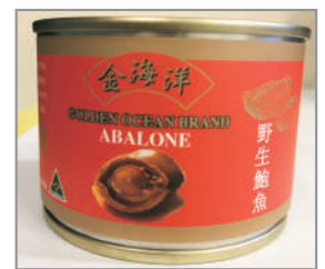
每位成人貴賓 均可獲贈一罐即食鮑魚(備註18)