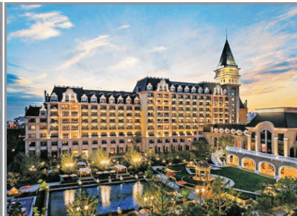
金沙灘希爾頓酒店