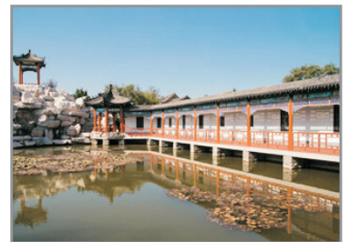
楊家埠民俗大觀園