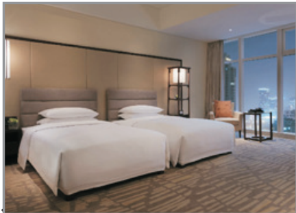
青島魯商凱悅酒店房間