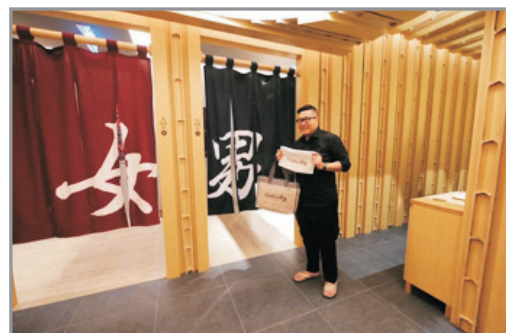
Grande Centre Point~ Sukhumvit 55