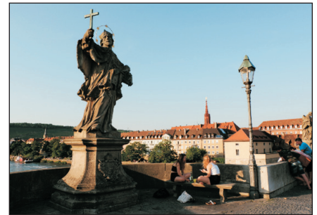
瑪利恩十二聖人橋