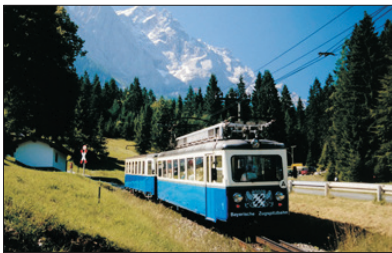
「高峰美景」 楚格峰大雪山

浪漫之路是以優雅的古堡及閒暇的鄉間風景著稱，起點是露芙堡，尾站是德國南部的富森，沿路上的風景美不勝收，看到鄉村的葡萄園景致、廣闊的平原、進入阿爾卑斯山領域，兩旁的景色也會從平原轉變成山丘和湖泊，美不勝收，秋冬也別有一番風味，自然風景充滿浪漫風情的城市。