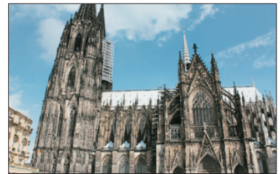
「世界文化遺產」 科隆大教堂

遊覽已被列入「世界文化遺產」、德國最大及歐洲最高的科隆大教堂，大教堂以歌德式建築，擁有著極重要的藝術價值。