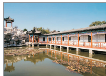
楊家埠民俗大觀園