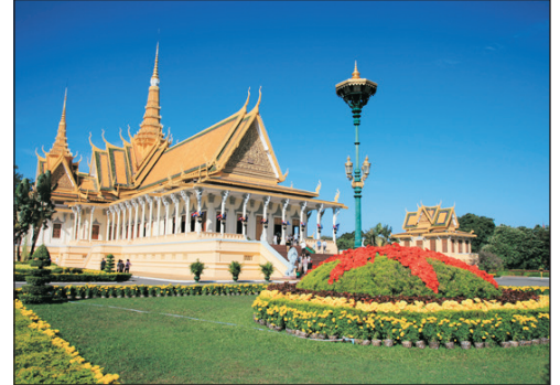
西哈莫尼國王皇宮

Day 3 暹粒—南大門—吳哥古城(大吳哥)—巴戎廟(高棉微笑)—鬥象台—12生肖塔—塔普倫廟—吳哥窟遺跡(小吳哥)#—吳哥窟夕陽奇景*—柬式古法按摩(自費)