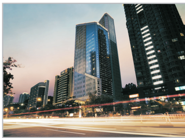
廈門泛太平洋大酒店外觀