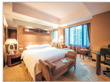
廈門泛太平洋大酒店房間