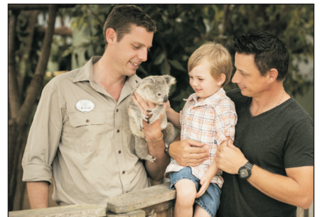
抱樹熊合照(每人1相)

#如遇Great Adventure或Sunlover船公司客滿或進行定期維修,則改乘Quicksilver。