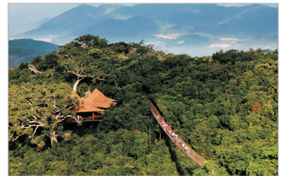
亞龍灣熱帶天堂森林公園

# 森林公園內不包過江龍索橋門票，敬請留意。亦可自費參與大佛石金海景玻璃棧道體驗。