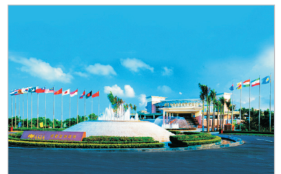
博鰲亞洲論壇成立會址