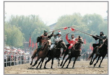
三國影視城(三英戰呂布真人戰馬秀)