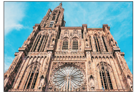
斯特拉斯堡聖母院主教堂