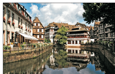
「小威尼斯」 伊爾河小法蘭西區

乘世界首創旋轉360度吊車，攀上海拔一萬呎的鐵力士峰，山峰終年積雪，沿途飽覽冰川遺蹟之奇景。抵達山頂，走進積雪底下的冰洞，置身於冰山雪嶺中。再踏上山頂平台舉目四盼，阿爾卑斯山脈群峰環列，氣勢磅礴。