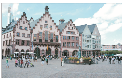
「德國第五大城」 法蘭克福

德國商業的中心、也是重要的國際金融城市。它正式的名稱為美茵河畔的法蘭克福(Frankfurt am Main)。自中世紀開始，一直為模範都市，現在多個國家的城市規劃都以此為借鏡。