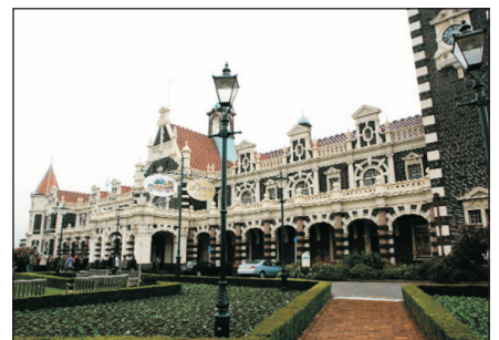
但尼丁古堡式火車站