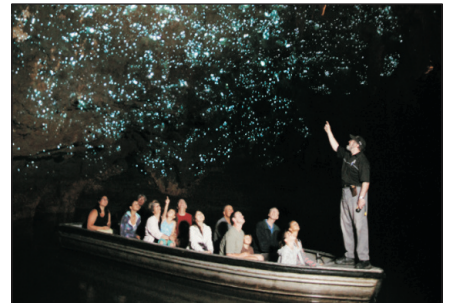
懷托摩鐘乳石洞及螢火蟲洞