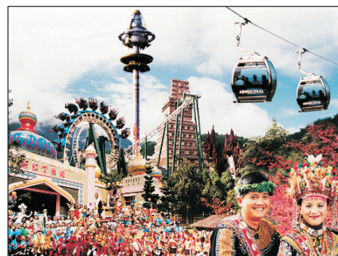
九族文化主題樂園