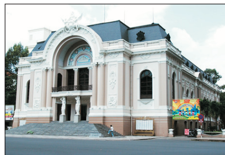
法國風情的市立歌劇院

古芝地道、戰爭博物館、越成料理烹飪班、聖母大教堂、 中央郵局、濱城市場、Bitexco金融塔觀景台