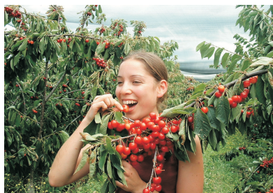
蘇瑞爾水果農莊園