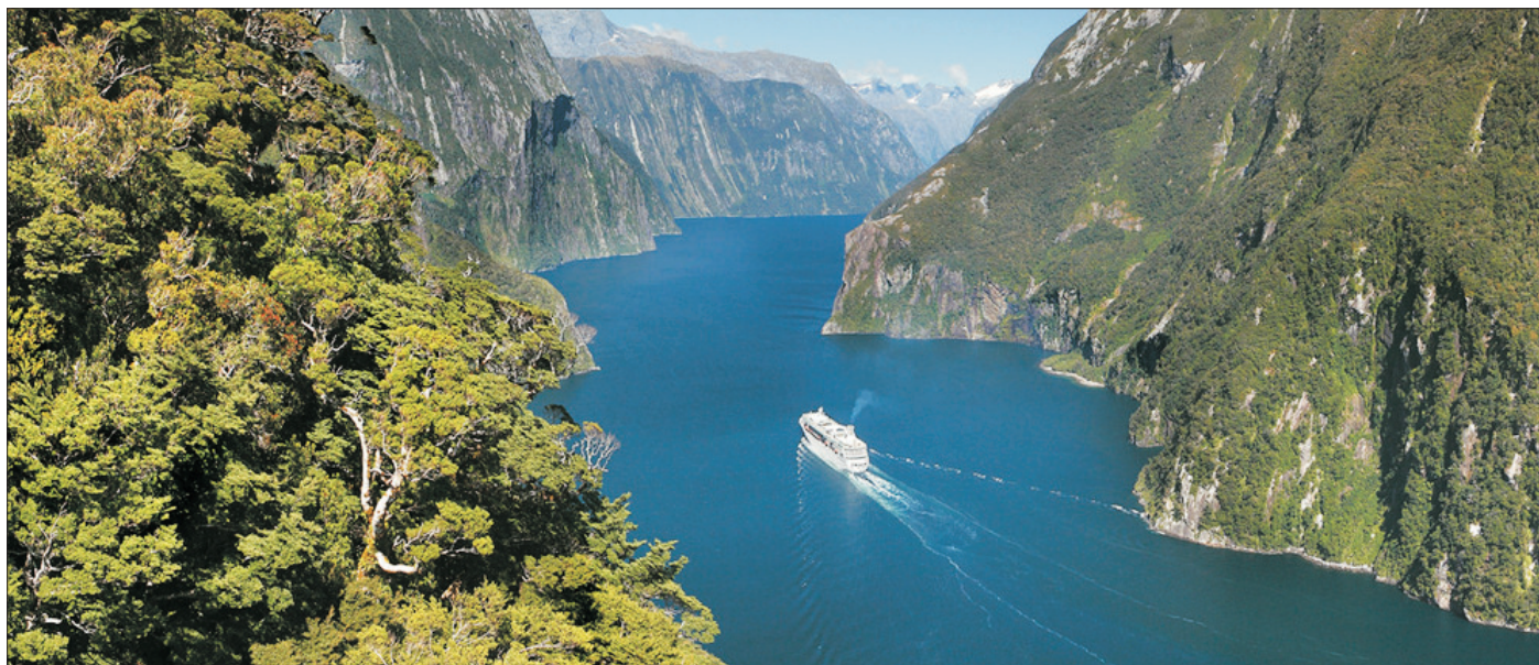
新西蘭峽灣國家公園