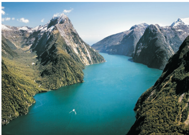
新西蘭峽灣國家公園