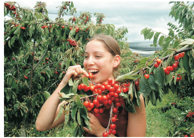
蘇瑞爾水果農莊園