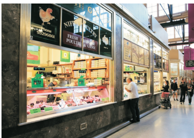
維多利亞女皇市場