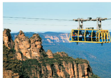
世界自然遺產~藍山國家公園