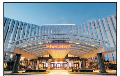
長春淨月潭益田喜來登酒店