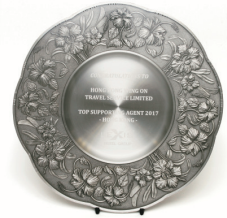
榮獲Lexis酒店集團頒贈 「2017年度香港銷售冠軍」之殊榮