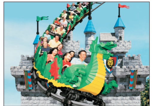
亞洲首座樂高樂園(Legoland) (包入場及任玩套票)