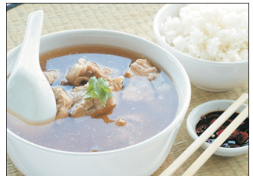
吃盡星馬地道美食