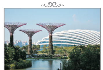
Gardens by the Bay~ Flower Dome & Cloud Forest Dome (包入場)