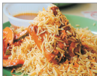
👍印度風味~黃薑飯+薄餅+拉茶