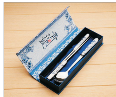
【精美紀念品】 景德鎮青花瓷餐具(每位一套)