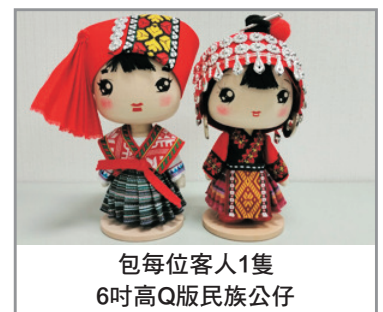
包每位客人1隻 6吋高Q版民族公仔

# 若因天氣問題或景區維修等原因而導致天星橋景區之纜車停開及銀鏈墜潭瀑布封閉，則未能安排參觀，客人不能藉此要求退出或賠償。