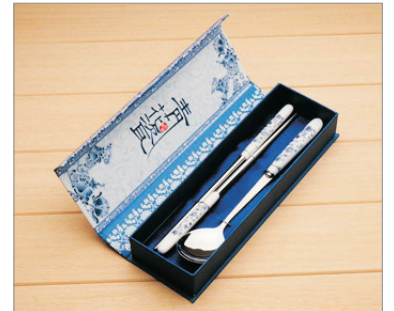
【精美紀念品】 景德鎮青花瓷餐具(每位一套)

即日起至12月31日出發 包每位品嚐江西軍山湖大閘蟹1隻(約3兩) (大閘蟹中之上品，曾於河蟹賽上獲「蟹王」之稱號)