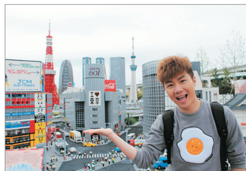
名古屋Legoland樂園(迷你樂園)

• 亞洲第二個Legoland樂園，佔地約9萬多平方米，園內劃分7大主題區域，如樂高城市、迷你樂園、樂高工廠、海盜海岸等，有多達40種精彩刺激的遊樂設施及表演，包括Legoland樂園必玩的「飛龍過山車」、亞洲首個海底探險潛水艇等，一家大細都啱玩。最不能錯過的是由約22萬塊積木砌成、近2米高的名古屋城模型，極具當地特色，作為Lego迷萬勿錯過！