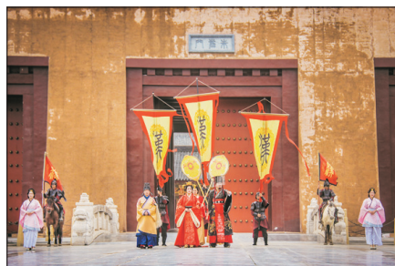
御林軍開城迎賓禮