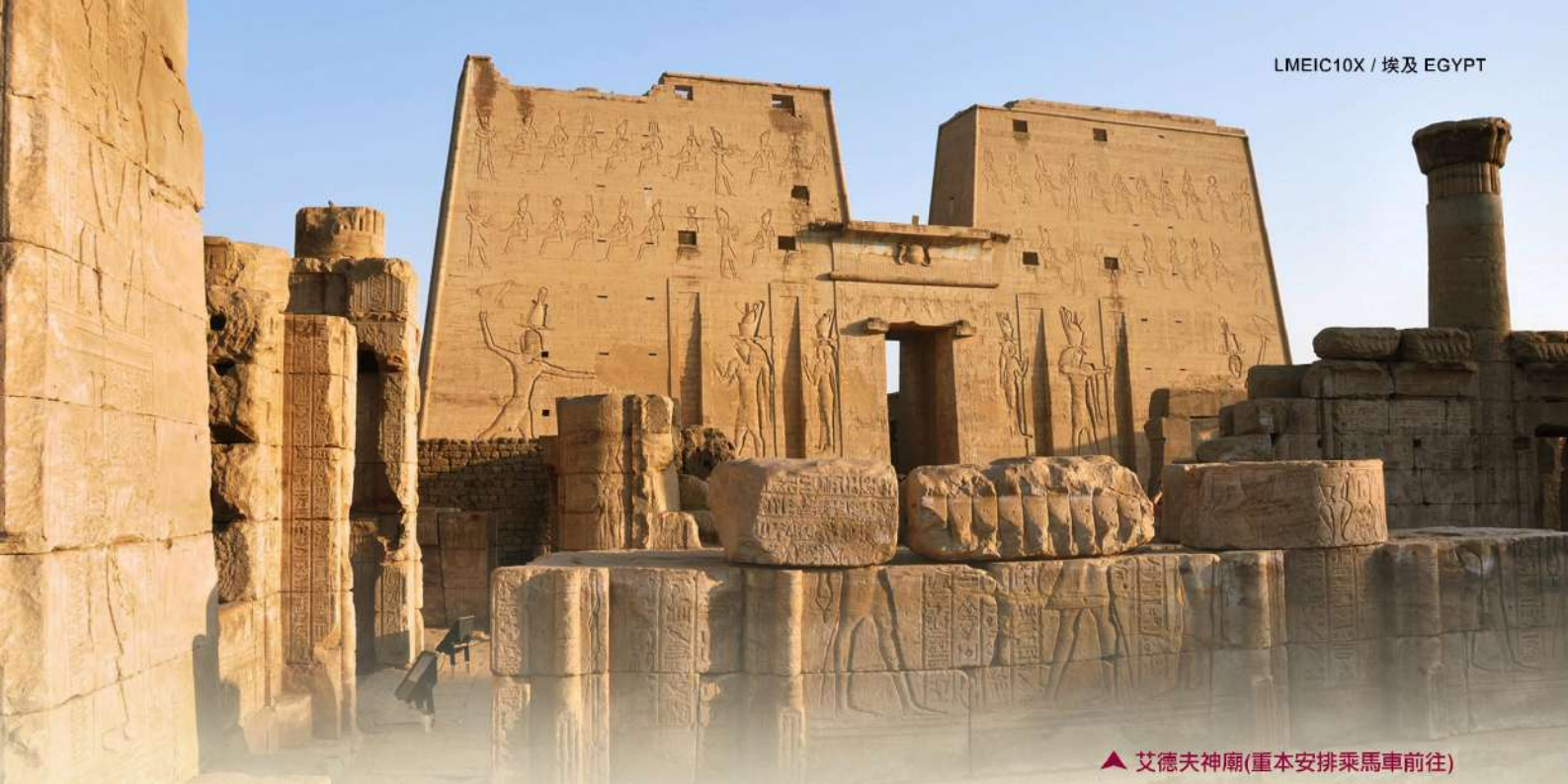
▲ 艾德夫神廟(重本安排乘馬車前往)