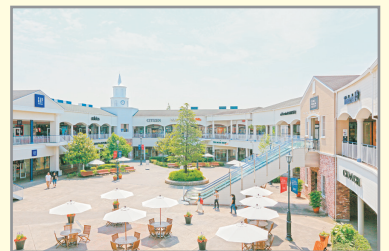
Rinku Premium Outlets