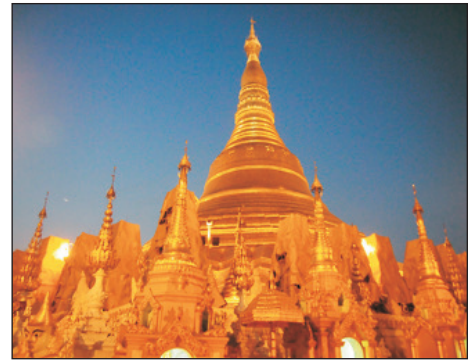
大金塔(包入場參觀)