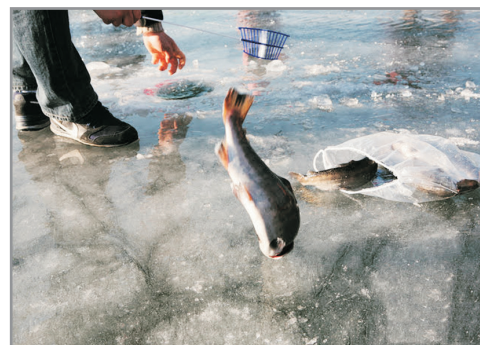
《增遊》華川山鱒魚慶典