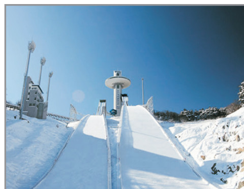
Ski Jump Lounge