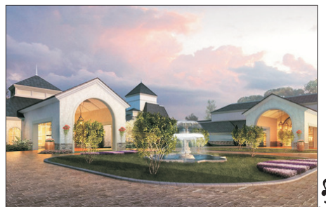
懷來皇冠假日酒店