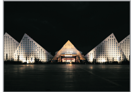
聖地天堂洲際大飯店