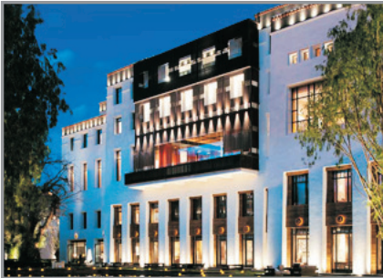
拉薩瑞吉度假酒店