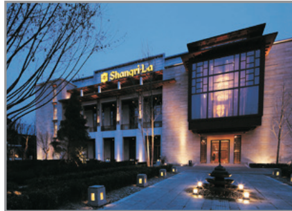
拉薩香格里拉大酒店