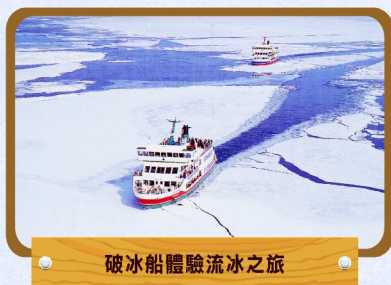
破冰船體驗流冰之旅

第70回札幌雪祭(註6) (2019年1月30日-2月6日出發適用) 第44回層雲峽冰瀑祭(註6) (2019年1月24日-3月13日出發適用)