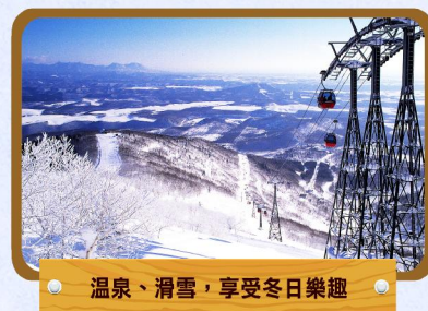
溫泉、滑雪，享受冬日樂趣

有日本最終秘境之譽，於2005年6月已正式成為日本第13個世界遺產。位於北海道東北部，面向鄂霍次克海伸出的知床半島擁有被原始森林覆蓋的險峻山嶽地帶，更有奇岩、瀑布等壯麗奇景。每年一月後，由俄羅斯流下之流冰群，長途跋涉下，到達知床半島停留下來，故亦有「流冰終點站」之稱。