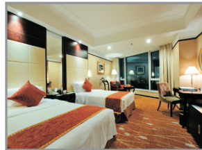
武漢江城明珠豪生酒店客房

坐落於鄰近觀光景點及商場的市中心，位置優越便利、設施完善舒適。酒店同時坐擁氣勢磅礴的長江美景，所有房間均享有武漢市區或長江的景觀。