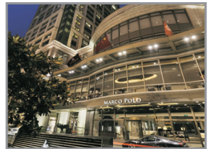
武漢馬哥孛羅酒店