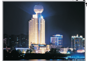
武漢江城明珠豪生酒店