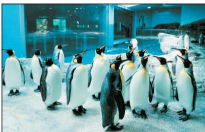
長崎企鵝水族館(日本·長崎)