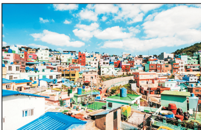
甘川洞文化村(釜山, 韓國)