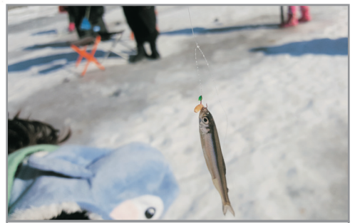
《增遊》楊平冰魚節 (1月8日至2月8日出發團隊適用)