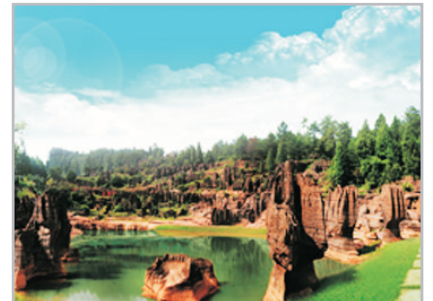
紅石林國家地質公園

永安貴賓尊享 美食廣場內集合(B2抵港樓層) 兼食埋早餐先出發! (只適用於上午6時半至10時集合時間) (CGDYS05XAT適用) (12月22-27日出發除外)