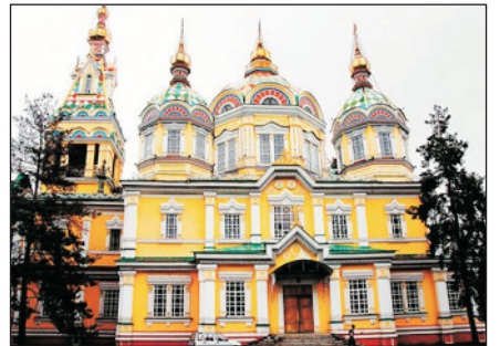
東正教升天大教堂