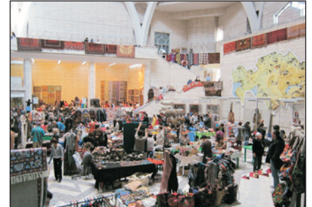
伊塞克歷史文化博物館