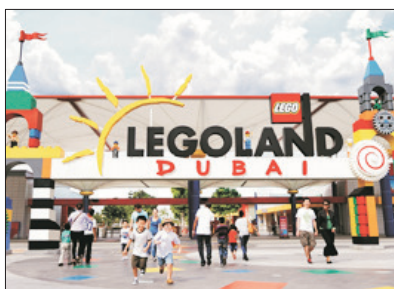
樂高主題樂園 Legoland Dubai (包門票)

於2016年10月開幕，為中東首個及全球第七個樂高主題樂園。園內共有六大主題園區，合共有超過四十種適合一家大細的遊樂設施，於「工廠園區」可了解積木的製造過程、在「城市園區」小朋友可嘗試到駕駛的樂趣、最特別的是在室內的「迷你城」中，可欣賞全由積木砌成、破紀錄17米高的「哈利法塔」。