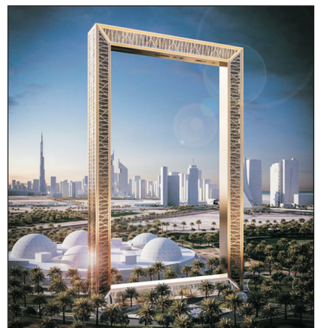
Dubai Frame 杜拜之框