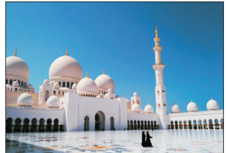
阿布達比大清真寺

# 阿布達比大清真寺入內參觀之所有人仕必須衣著端莊及整齊，詳情請向本公司職員查詢。