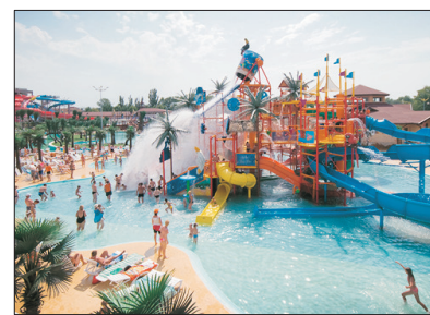
Wild Wadi水上樂園 Wild Wadi Water Park (包門票)

於2016年開幕，耗資近30億美元建造，是一個集合了休閒娛樂、購物美食、酒店住宿及三個「世界級」主題樂園(樂高主題公園、荷里活電影主題公園及寶萊塢電影主題樂園)的大型度假區，合共佔地三千多平方公里。