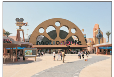
Dubai Park and Resorts

~ Legoland Dubai ：是中東地區首個樂高主題樂園，擁有超過40個以樂高為主題的遊樂設施、表演、建築等。除了可目睹Lego的生產過程之外，園內更有專為小朋友而設的划船學校、駕駛學校等，提供一個新奇的學習體驗。在這裡，由參觀、學習到玩樂都能為你和小朋友帶來難而忘懷的玩樂體驗。