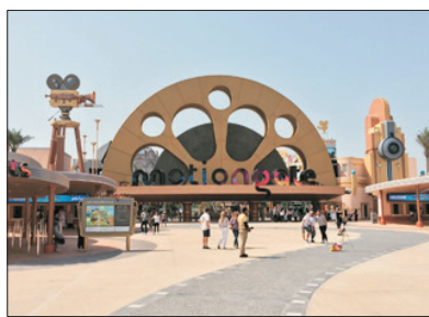
Dubai Park and Resorts (包昂貴門票及任玩遊樂設施)

於2016年10月開幕，為中東首個及全球第七個樂高主題樂園。園內共有六大主題園區，合共有超過四十種適合一家大細的遊樂設施，於「工廠園區」可了解積木的製造過程、在「城市園區」小朋友可嘗試到駕駛的樂趣、最特別的是在室內的「迷你城」中，可欣賞全由積木砌成、破紀錄17米高的「哈利法塔」。