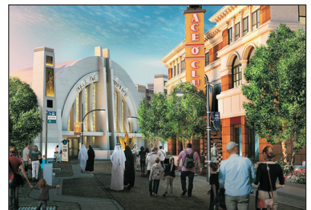
華納兄弟主題樂園