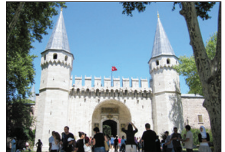
杜伯奇皇宮博物館