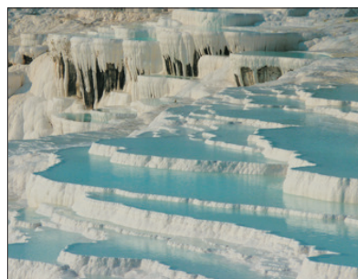
「世界自然及文化雙遺產」 棉花堡

特別安排於「世界自然及文化雙遺產」～奇石區(加柏都斯亞)遊覽，此處地形奇特，有許多由火山熔岩形成尖岩、懸崖、深谷等。團友可飽覽被稱為「仙境煙窗」的山岩，外形就如金字塔型、圓錐型、或看似戴上帽子的石柱，奇特有趣。