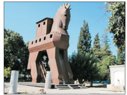
「世界文化遺產」 特洛伊古城

暢遊「世界自然及文化雙遺產」～棉花堡，石灰質聚結而形成棉花狀之岩石，層層疊疊，構成自然壯觀之岩石群和水池。