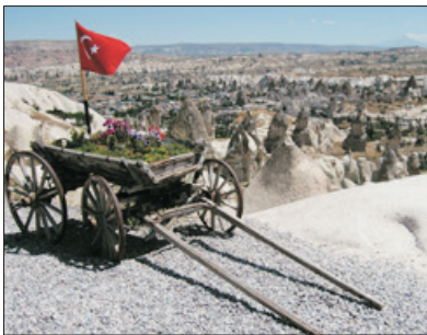
「世界自然及文化雙遺產」 奇石區

特別安排於「世界自然及文化雙遺產」～奇石區(加柏都斯亞)遊覽，此處地形奇特，有許多由火山熔岩形成尖岩、懸崖、深谷等。團友可飽覽被稱為「仙境煙窗」的山岩，外形就如金字塔型、圓錐型、或看似戴上帽子的石柱，奇特有趣。