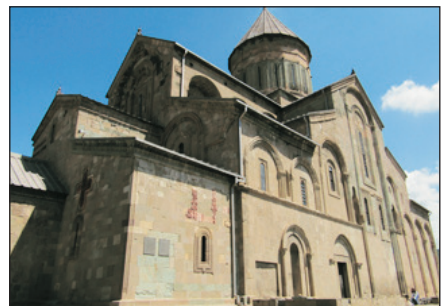
斯維傑茨霍裡大教堂