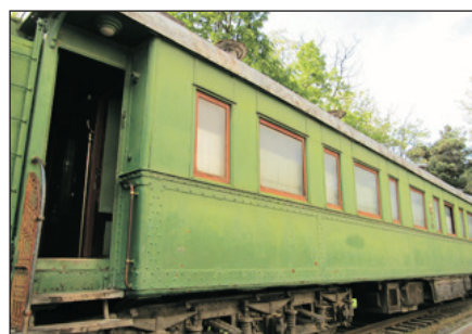
史太林專用火車車廂