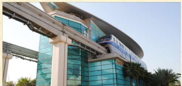
▲ Dubai Monorail單軌鐵路

· 杜拜湖音樂噴泉 ：2009年中全新開幕，高150米，長275米，糅合了音樂和躍動水柱，變幻出1000種不同的聲光效果造型，給你震撼的視覺新享受!