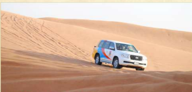
▲ 沙漠四驅車之旅(自費參加)

· 自費活動—沙漠四驅車活動 ：乘坐冷氣四驅車於沙漠起伏不定之沙丘上奔馳，欣賞肚皮舞表演及享用特色燒烤餐。(註4)