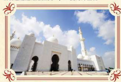
世界第三大 阿布達比大清真寺

遊覽2010年開幕之超級摩天大樓-哈利法塔，樓高828米，更安排乘搭電梯直達124/F全球最高的觀光層飽覽杜拜景色。樓層逾160層，95公里外仍可見。杜拜塔創下了多個世界紀錄，包括世界第一高樓、最高獨立建築、樓層最多、最高戶外觀景台等等。