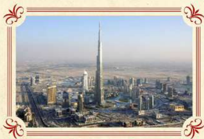
世界最高 哈利法塔Burj Khalifa

2009年中開幕，高150米，長275米，糅合了音樂和躍動水柱，變幻出1000種不同的聲光效果造型，給你震撼的視覺新享受！