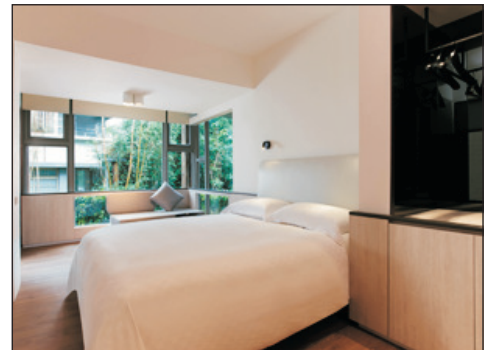
宜蘭傳藝老爺行旅