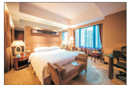
廈門泛太平洋大酒店