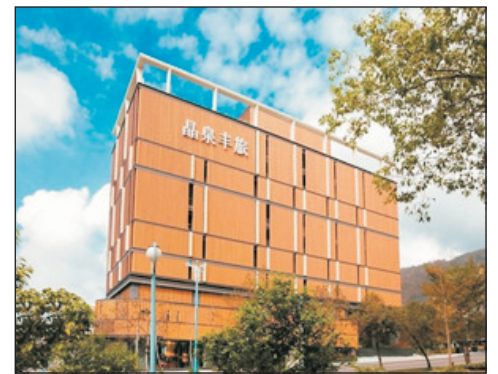
Regent集團礁溪晶泉丰旅溫泉酒店