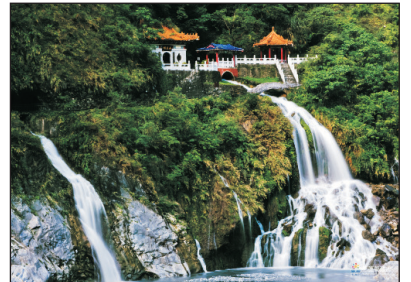
太魯閣國家公園-長春祠

·「下田拔蔥體驗」:宜蘭三星鄉的「三星蔥」聞名全省,因為土地肥沃和乾淨的水源,三星蔥吃起來比一般的還要鮮甜。在園內,除了有精彩豐富的遊覽解說外,一家大小還可以親自下田體驗採蔥、洗蔥樂趣,更安排蔥油餅DIY活動,一邊欣賞田園風光,一邊品嚐自己親手製作的蔥油餅,絕對是一個難得的體驗活動。