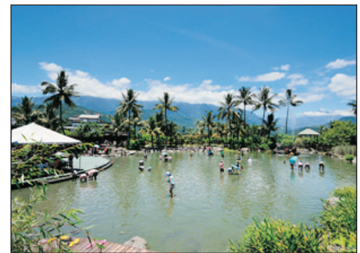
立川漁場~摸蜆體驗