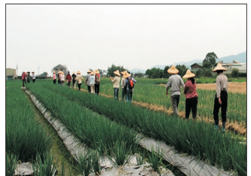
下田拔蔥+蔥油餅DIY體驗