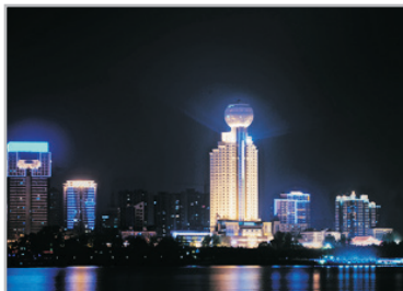
武漢明珠豪生酒店