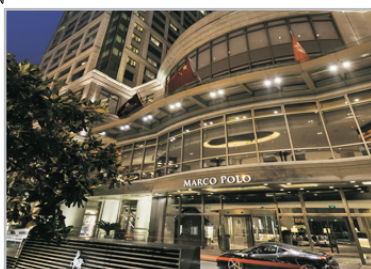
武漢馬哥孛羅酒店