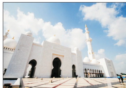
阿布拉達比大清真寺

~ Lost Chamber海底世界 ：容量1100萬公升的水族館，更可以看見魚群暢游，且有魔鬼魚及鯨鯊在潛水員身邊游過的驚險場面吸引遊客。想發掘沉睡海底數千年的亞特蘭提斯神秘遺跡，還可以穿越大使潟湖下的迷宮一般的海底隧道。本社安排昂貴入場門票，讓你透過玻璃通道近距離觀賞65,000隻海洋生物。