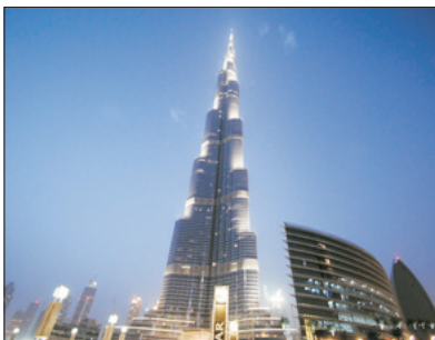
哈利法塔Burj Khalifa 124/F全球最高觀光層(包門票)

前往全世界最高摩天大樓之哈利法塔Burj Khalifa參觀樓高828米，樓層逾160層，更安排乘搭電梯到達124/F全球最高的觀光層飽覽杜拜景色，天氣好時，可遠眺80公里外的美景。被譽為世界第一高樓、最高獨立建築、樓層最多、最高戶外觀景台等等。