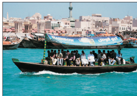
杜拜傳統水上的士ABRAS