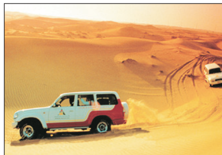
沙漠四驅車活動(自費參加)

△ 如遇上當地回教節日或慶典(如：齋戒月等)，肚皮舞表演將被取消，恕不另行通知。