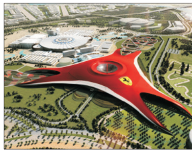
法拉利主題樂園 (包門票及暢玩指定遊戲)

前往全世界最高摩天大樓之哈利法塔Burj Khalifa參觀樓高828米，樓層逾160層，更安排乘搭電梯到達124/F全球最高的觀光層飽覽杜拜景色，天氣好時，可遠眺80公里外的美景。被譽為世界第一高樓、最高獨立建築、樓層最多、最高戶外觀景台等等。